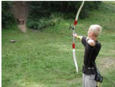
Jagt stævne (løve) i Gels skov Træning for seniorer