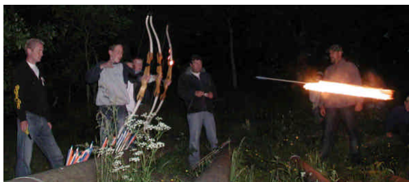
Sommerlejr 2007 falder på Sankt Hans aften

Invitationen kommer i løbet af marts måned. Da mange jo planlægger frem i tiden, foreslår vi at man allerede nu reserverer denne weekend.