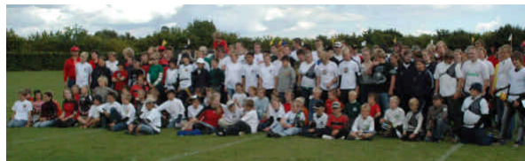
Deltagere ved ungdoms DM 2005 i Taastrup

Ved øvrige stævner henstilles der at man stiller op i TIK trøje, da man repræsenterer klubben.