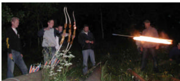
Sommerlejr 2007 falder på Sankt Hans aften

Invitationen kommer i løbet af kort tid. Da mange jo planlægger frem i tiden, foreslår vi at man allerede nu reserverer denne weekend.