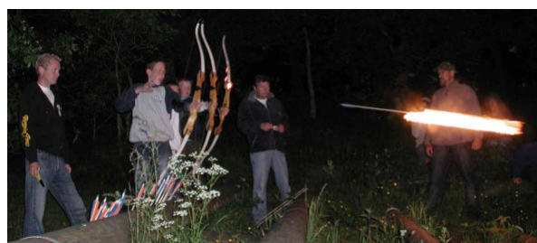
Sommerlejr 2006 falder på Sankt Hans aften

Herudover henvises til klubbens hjemmeside