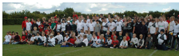
Deltagere ved ungdoms DM 2005 i Taastrup

Ved øvrige stævner henstilles der at man stiller op i TIK trøje, da man repræsenterer klubben.