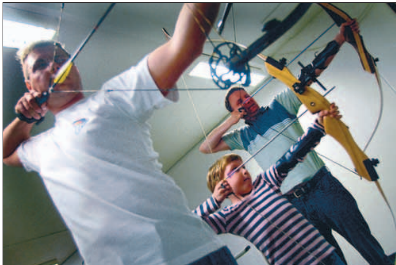
Også sportsidioten ramte skiven. Måske fordi den var rykket ind på otte meters afstand.